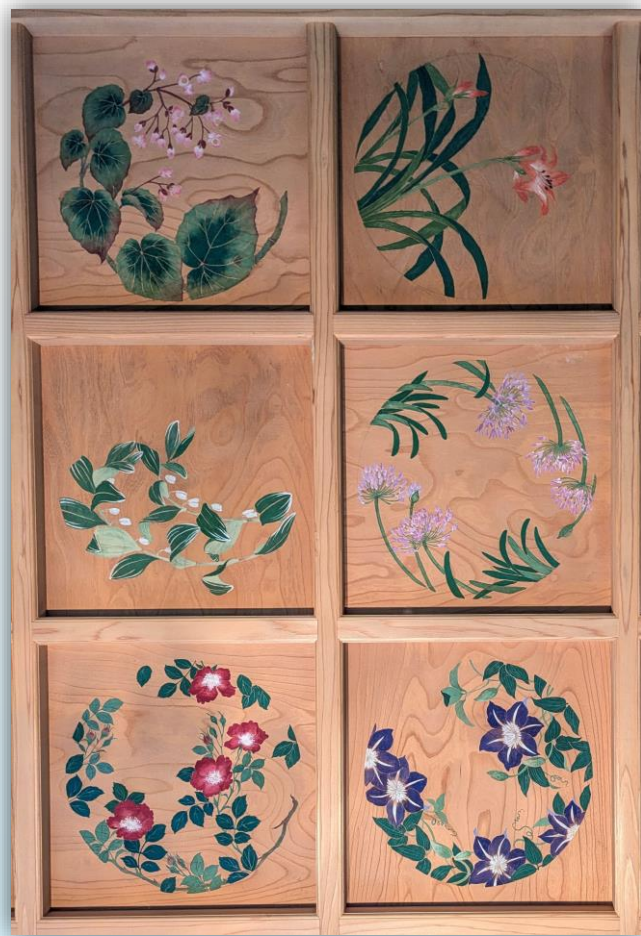
天井絵(河和田組光常寺本堂) 小笠 千奈津(前坊守) 作画